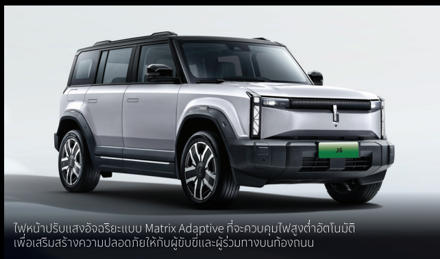
ไฟหน้าปรับแสงอัจฉริยะแบบ Matrix Adaptive ที่จะควบคุมไฟสูงต่ำอัตโนมัติ เพื่อเสริมสร้างความปลอดภัยให้กับผู้ขับขี่และผู้ร่วมทางบนท้องถนน