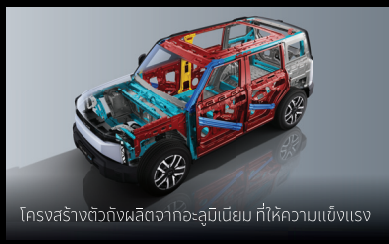
โครงสร้างตัวถังผลิตจากอะลูมิเนียม ที่ให้ความแข็งแรง