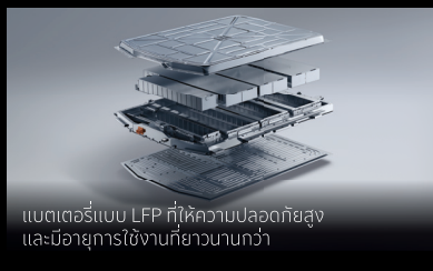
แบตเตอรี่แบบ LFP ที่ให้ความปลอดภัยสูง และมีอายุการใช้งานที่ยาวนานกว่า