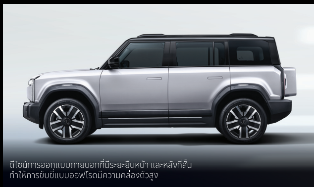
ดีไซน์การออกแบบภายนอกที่มีระยะยื่นหน้า และหลังที่สั้น ทำให้การขึ้นขี่แบบออฟโรดมีความคล่องตัวสูง