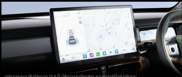
จอควบคุมแบบสัมผัสขนาด 15.6 นิ้ว ให้ความละเอียดสูง และแสดงผลได้อย่างชัดเจน