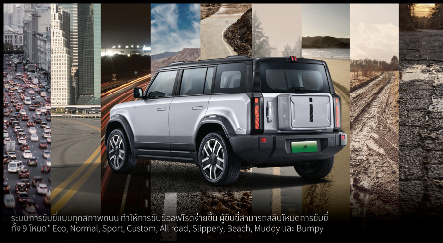
ระบบการขับขี่แบบทุกสภาพถนน ทำให้การขับขี่ออฟโรดง่ายขึ้น ผู้ขับขี่สามารถสลับโหมดการขับขี่ถึง 9 โหมด* Eco, Normal, Sport, Custom, All road, Slippery, Beach, Muddy และ Bumpy