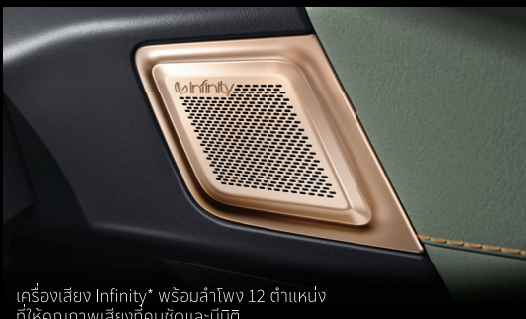
เครื่องเสียง Infinity* พร้อมลำโพง 12 ตำแหน่ง ที่ให้คุณภาพเสียงที่คมชัดและมีมิติ